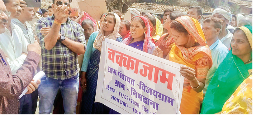
हरिभूमि न्यूज ▶▶ बैतूल

बैतूल-अमरावती स्टेट हाईवे पर भैंसदेही विकासखंड की विजयग्राम पंचायत के नीमढाना गांव के ग्रामीणों ने पेयजल और सड़क निर्माण की मांग को लेकर आज मंगलवार को दोपहर को चक्काजाम कर दिया, जिससे वहां वाहनों की लंबी कतारें लग गईं और प्रशासनिक अधिकारी मौके पर पहुंचकर ग्रामीणों को समझाने का प्रयास कर रहे हैं। ग्रामीणों का कहना है कि नीमढाना गांव में लंबे समय से पेयजल संकट बना हुआ है और दैनिक जरूरतों के लिए भी पानी नहीं मिल पा रहा है। पानी के अलावा गांव की सड़कें भी बेहद खराब हालत में हैं, जिससे लोगों को आवागमन में भारी परेशानी का सामना करना पड़ रहा है। ग्रामीणों ने इन समस्याओं को लेकर कई बार पंचायत और संबंधित अधिकारियों को आवेदन देकर शिकायतें भी कीं, लेकिन अब तक उन्हें