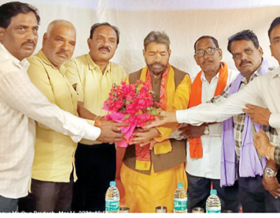
हरिभूमि न्यूज ▶▶ शाहपुर